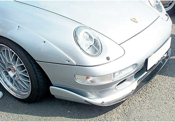
So ist es richtig: Genügend Platz durch Verbreiterung der Kotflügel, tief eingestelltes Fahrwerk bei gleichzeitig gutem Fahrverhalten

Ein tiefes und breites Auftreten ist für jedes Tuning-Auto obligatorisch. Damit sich das Fahrzeug dem Asphalt wie gewünscht nähert, sind kürzere Federn oder aber ein komplettes Fahrwerk fällig. Neben der Optik ist aber noch mehr zu beachten.