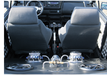
Ein Blick über den Rand des Erdbeerkörbchens offenbart Erstaunliches

schicken Zusatz-Instrumenten. „Als nächstes kommen Lederstühle rein“, verrät uns Christin zum Abschied, steigt ein und fährt los. Aber so leicht verschwindet sie auch beim Abbiegen um die Hausecke nicht, denn wir hören sie noch.